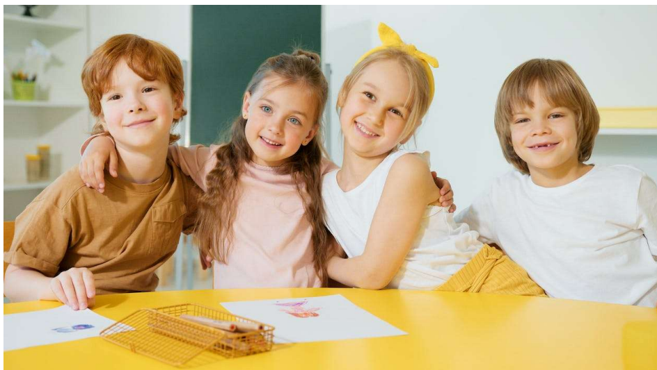
Abbildung 3: Bild mit Kindern