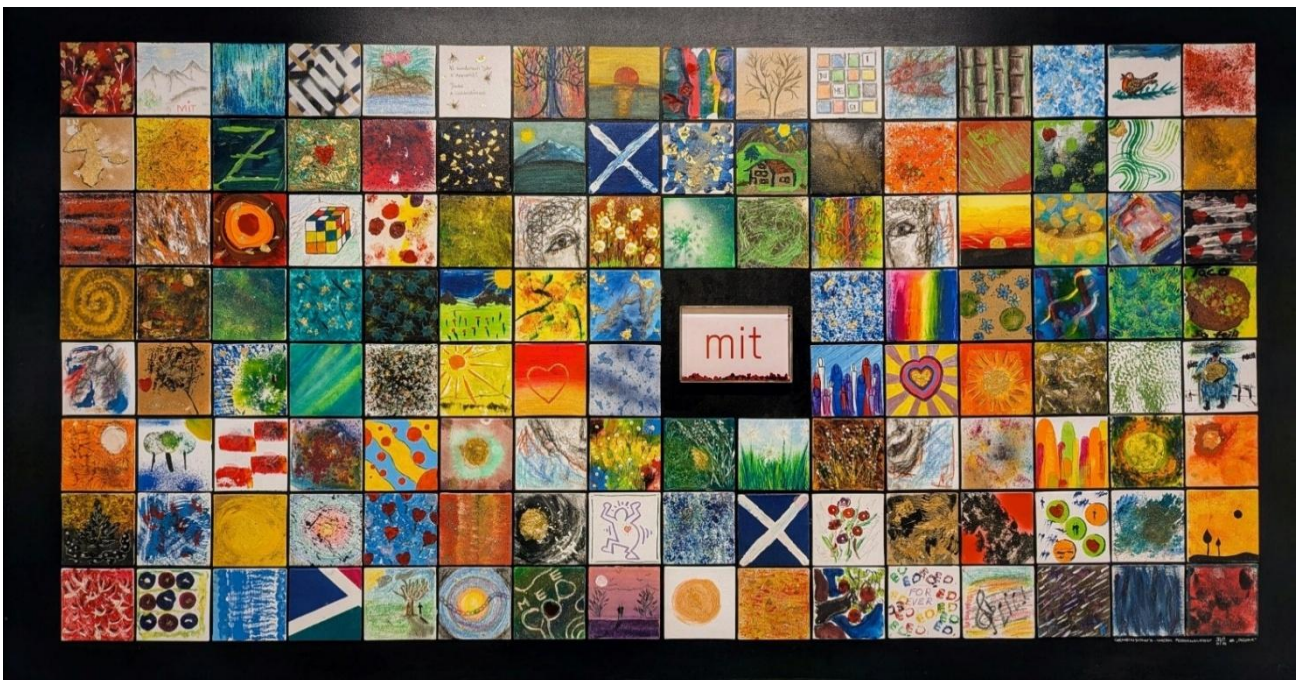
Gemeinschaftswerk Personalfest 2024